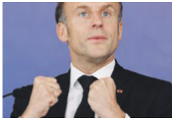
Il Presidente francese Macron.

KIEV L'esercito russo ha conquistato due villaggi ad Avdiivka, in Ucraina orientale. L'avanzata di Mosca preoccupa l'Europa. Il presidente francese Emmanuel Macron è tornato a ribadire la possibilità di inviare truppe occidentali se Kiev lo chiedesse. Intanto gli Usa accusano l'esercito russo di aver fatto uso di armi chimiche nel corso degli attacchi in Ucraina. Accuse mosse in vista della conferenza di pace in Svizzera. A PAG. 2