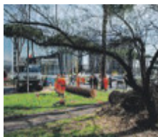
Il 19 aprile un caso sulla Colombo

all'altezza dell'incrocio con viale Asia: un albero enorme è crollato centrando due auto in marcia. Si stima siano 50 mila gli arbusti a rischio crollo: per il nuovo bando 2024-2026 di manutenzione integrata del verde verticale e orizzontale sono circa 100 milioni i fondi stanziati dal Comune.