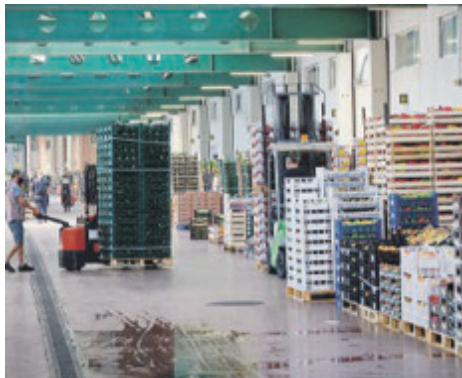
Il Car di Roma sarà secondo solo a Parigi e Barcellona

L'estensione interessa le aree che confinano con l'attuale comprensorio del Car e consentirà di sviluppare un nuovo hub strategico del food, attraverso il miglioramento delle attività già presenti e l'implementazione di nuovi servizi. Inoltre si sti-