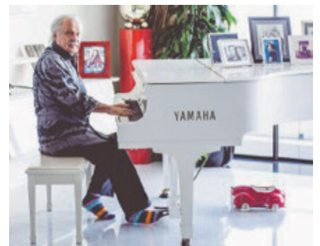
Il compositore premio Oscar Giorgio Moroder riceverà il David di Donatello alla Carriera 2024.

ospiti della serata, tutti i candidati al David, i registi premio Oscar Justine Triet e Paolo Sorrentino, e poi Claudia Gerini, Eleonora Giorgi, Elena Sofia Ricci e Isabella Rossellini, Federico Ielapi, Nicolas Maupas e Josh O'Connor, Malika Ayane e Giorgia, Irama e Mahmood.