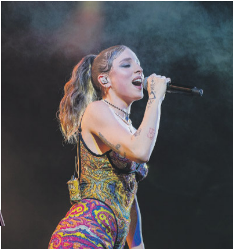
Angelina Mango, vincitrice di Sanremo 2024, rappresenterà l'Italia con "La Noia" all'Eurovision Song,