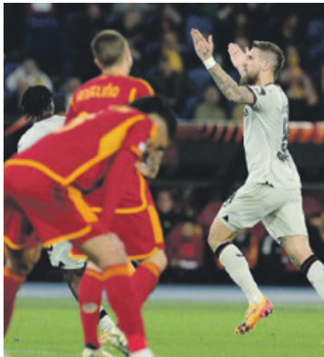
Un passivo molto pesante per la Roma

Atalanta subito in gol Gara giocata a ritmi alterni, tra fiammate e lunghe fasi di studio. Si parte ovviamente con le fiammate: l'Atalanta - ieri molto