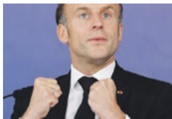
Il Presidente francese Macron.

KIEV L'esercito russo ha conquistato due villaggi ad Avdiivka, in Ucraina orientale. L'avanzata di Mosca preoccupa l'Europa. Il presidente francese Emmanuel Macron è tornato a ribadire la possibilità di inviare truppe occidentali se Kiev lo chiedesse. Intanto gli Usa accusano l'esercito russo di aver fatto uso di armi chimiche nel corso degli attacchi in Ucraina. Accuse mosse in vista della conferenza di pace in Svizzera. A PAG. 2