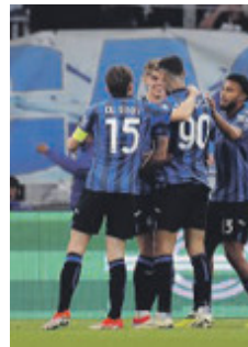
Gioia Atalanta

ma pareggia: passano pochi minuti - nove per l'esattezza - e al 20 arriva infatti la rete del pareggio del Marsiglia con Mbemba. Il Marsiglia costruisce molto (11 i corner battuti)