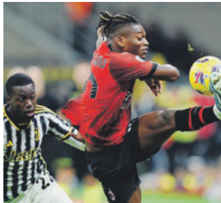
Leao: anche lui sotto esame.

che nemmeno l'appena conquistata finale di Coppa Italia ha rischiarato, ed il tecnico Massimiliano Allegri è sempre più al centro delle critiche per un gioco sparagnino e poco efficace. Ed è in bilico. Il Milan invece ha appena assistito dal campo ai festeggiamenti dell'Inter per la seconda stella, dopo aver assistito nella stessa settimana a quelli della Roma per il passaggio alla semifinale di Europa Lea-