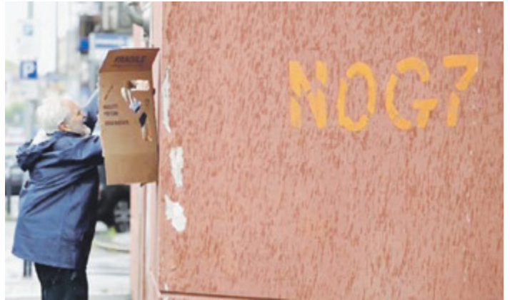
Il blitz attuato nei giorni scorsi a Venaria.

Lunedì scorso un attivista di Ultima Generazione ha compiuto un'azione davanti al cinema di Venaria Reale, scrivendo sul muro "No G7" e spruzzando vernice lavabile sulla facciata. Da quel luogo lunedì 29 aprile, alle 10, partirà una manifestazione promossa da Ultima Generazione insieme a XR, NoTav, Ecologia Politica, Recommon, End Fossil. Un secondo appuntamento di protesta sul clima è già annunciato con un'assemblea popolare a Roma l'11 maggio.