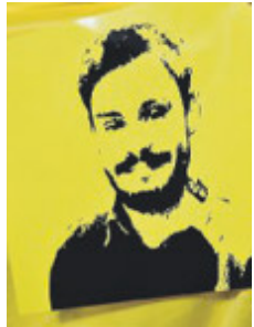
Giulio Regeni.

Il vertice mira ad individuare azioni coerenti, complementari e interconnesse per affrontare la crisi climatica, energetica