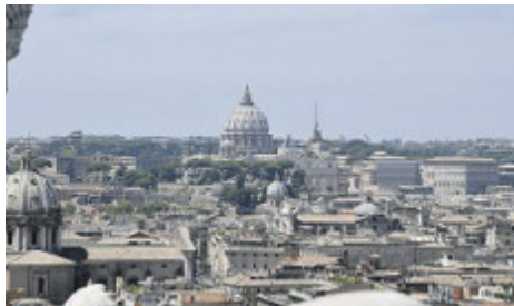
L'allarme è scattato in pieno centro a Roma.

Secondo la ricostruzione dei vigili del fuoco, che per soccorrere gli intossicati hanno dovuto indos-