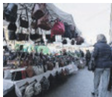
Stretta su abusivi in centro.

sequestri: 30 solo tra le vie intorno a Fontana di Trevi, come via delle Muratte e via del Lavatore. Tra gli articoli sequestrati: occhiali, bastoni per selfie, foulard, accessori di elettronica, articoli di abbigliamento e, in alcuni casi, borse e articoli contraffatti di noti marchi della moda.