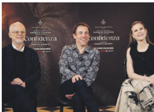
Il regista Daniele Luchetti con gli attori Elio Germano e Federica Rosellini durante la presentazione del film.