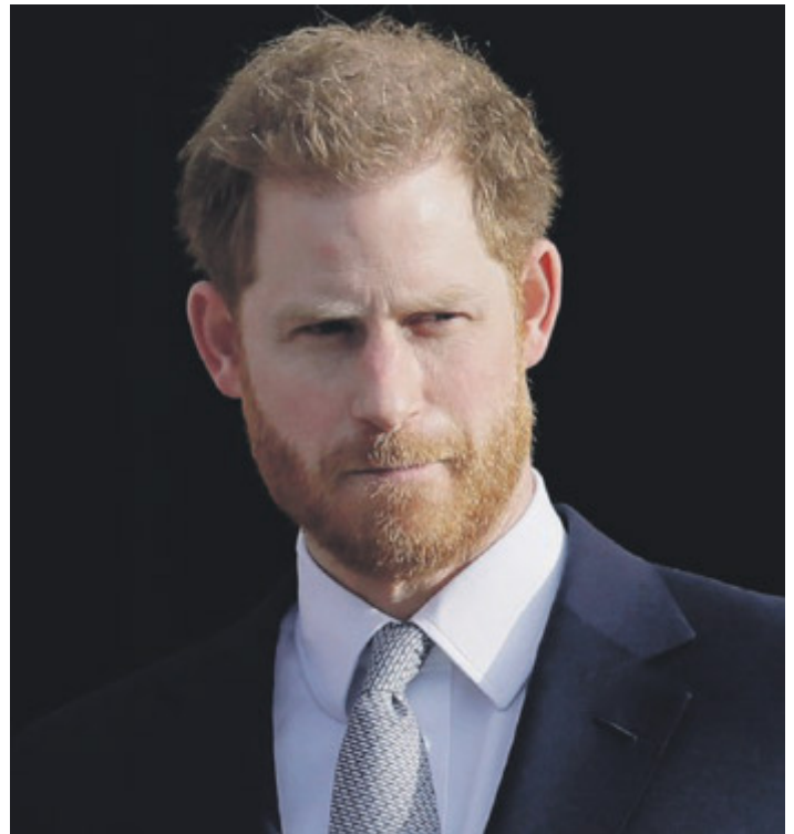
Il principe Harry

sa in patria e ha quindi deciso di vendicarsi cambiando la residenza. Il figlio del re d'Inghilterra è ormai "americano". E quindi starebbe considerando addirittura di chiedere la cittadinanza americana. Per farlo, però, dovrebbe rinunciare al titolo di principe e duca e alla sua posizione in linea di successione al trono. Un passo troppo definitivo che per ora non è una priorità, ha spiegato. Ma non è escluso che ciò possa accadere in futuro.