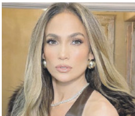
Jennifer Lopez

D'altronde Jennifer non ha mai fatto mistero di aver lavorato duramente non solo in palestra, ma anche sulla sua sicurezza interiore, di aver attraversato fasi alterne, in cui l'autostima non era sempre al top. Ma non si è mai scoraggiata ed è sempre riuscita a superare tutto con il sorriso.