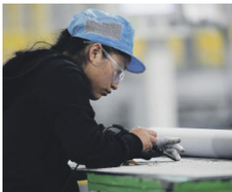
A Roma saldo imprenditoriale in attivo.

CITTÀ Roma e il Lazio mostrano dati economici incoraggianti. La Capitale, nel primo trimestre del 2024, ha registrato il miglior saldo imprenditoriale a livello italiano: 9mila iscrizioni a fronte di 7.713 cessazioni, pari a un saldo attivo di +1.287 imprese. Oltre ad un tasso di crescita dello 0,29%, (in controtendenza rispetto alla media nazionale che pari a -0,18%). Il numero totale delle imprese registrate a fine marzo 2024, a Roma e provincia, è di 444.295 unità. Per quanto riguarda le forme giuridiche, a Roma, dominano le società di capitale con oltre 237mila unità iscritte al Registro imprese, seguite