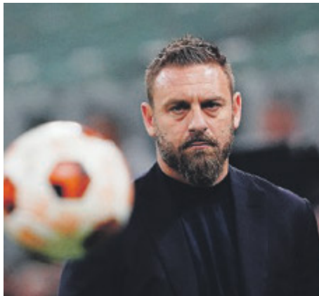
Daniele De Rossi.

ma spiaggia». Lo ha detto ieri l'allenatore della Roma Daniele De Rossi in conferenza stampa alla vigilia del ritorno dei quarti di finale di Europa League contro il Milan di oggi. All'andata i rossoneri avevano perso in casa per 1-0. Sulle possibilità di vittoria della Roma i bookmakers vedono il passaggio del turno per De Rossi a 1,57 contro l'approdo del Milan al turno successivo a 4,75. In Europa League