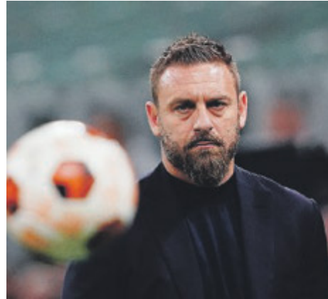
Daniele De Rossi.

ma spiaggia». Lo ha detto ieri l'allenatore della Roma Daniele De Rossi in conferenza stampa alla vigilia del ritorno dei quarti di finale di Europa League contro il Milan di oggi. All'andata i rossoneri avevano perso in casa per 1-0. Sulle possibilità di vittoria della Roma i bookmakers vedono il passaggio del turno per De Rossi a 1,57 contro l'approdo del Milan al turno successivo a 4,75. In Europa League