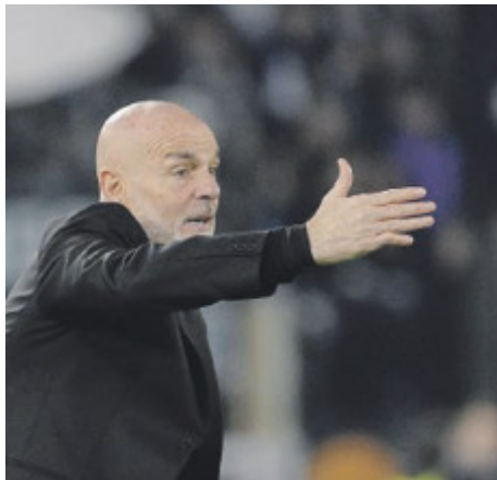
Mister Stefano Pioli vuole l'Europa.

La Roma, dimenticato il derby, vuole ripetersi in Europa (dove l'anno scorso è stata finalista). Non ci sarà però lo squalificato Ndicka né l'infortunato Azmoun. Ballottaggio Spinazzola-Angelino. De Rossi ha lanciato un messaggio che è tutto un programma: «Non siamo qui a fare le comparse. Qui non esiste un pareggio». E