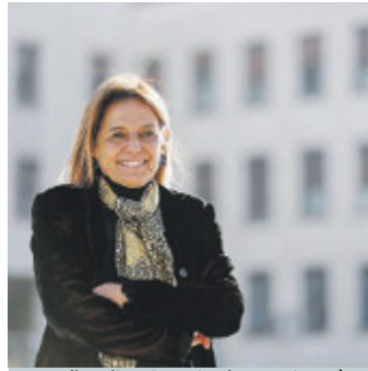
Antonella Polimeni, rettrice de La Sapienza.

Oltre 800 nuovi posti letto dedicati agli studenti in tre città universitarie italiane: Padova, Modena e Pisa. È il risultato dell'accordo tra CDP Real Asset SGR (Gruppo Cassa Depositi e Prestiti) e Finint Investment (Gruppo Banca Finint) che ieri hanno annunciato l'ingresso del Fondo Nazionale dell'Abitare Sociale (FNAS) di CDP RA SGR nel Fondo Pitagora di Finint Investments, dedicato allo sviluppo di iniziative immobiliari nell'ambito del mercato degli alloggi per studenti. Tutti i progetti propongono un'offerta di alloggi dotati di servizi moderni a condizioni accessibili.