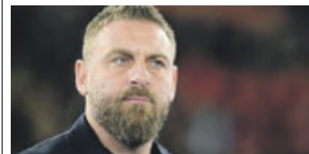
De Rossi. /LAPRESSE

DISPONIBILE SU Spotify Music amazon music Google Podcasts Apple Podcasts