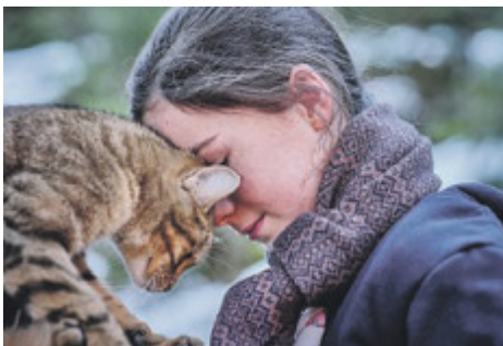
Dai film "Vita da Gatto" di Maudatchevsky, e "Il mio amico Robot".

"Vita da Gatto" - spiega il regista - è una storia di apprendimento su come due persone possono costruirsi. Mostra come, durante una separazione, una terza parte, in questo caso il gatto, intervenga per aiutare. Credo molto nell'idea che un animale possa portare serenità. Volevo raccontare la specie felina così com'è: carina, ma anche cacciatrice, predatrice, capace di giocare con le sue prede. Volevo che i bambini capissero che il gatto ha la sua libertà. E che sta a lui decidere se prenderla o meno.