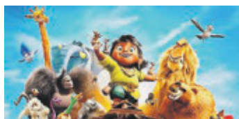
Tito e Vinni - A tutto Ritmo.