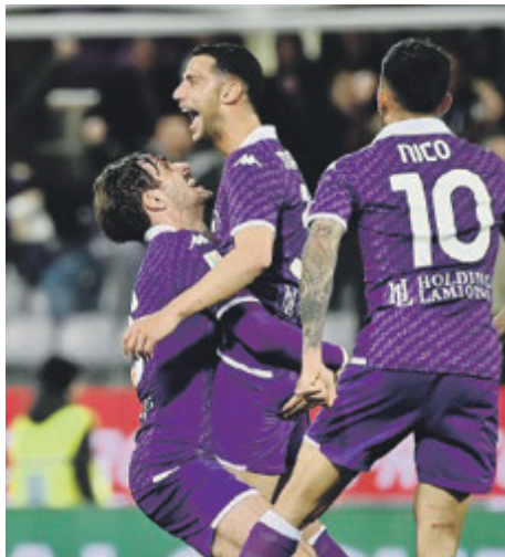
Imprendibile il siluro di Mandragora: è 1-0.

co dall'inizio alla fine, costringendo l'Atalanta nella propria metà campo tanto che è stato il portiere atalantino Carnesecchi a tenere in vita la sua squadra con almeno un paio di interventi prodigiosi - che da soli valevano il prezzo del biglietto - che hanno evitato di imbarcare altri gol. Quello su Nico Gonzalez resterà negli annali del calcio. La palla velenosa del pari è capitata all'Atalanta al 66', ma Bakker si è