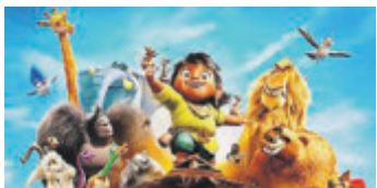
Tito e Vinni - A tutto Ritmo.