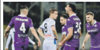
Rolando Mandragora . /LAPRESSE