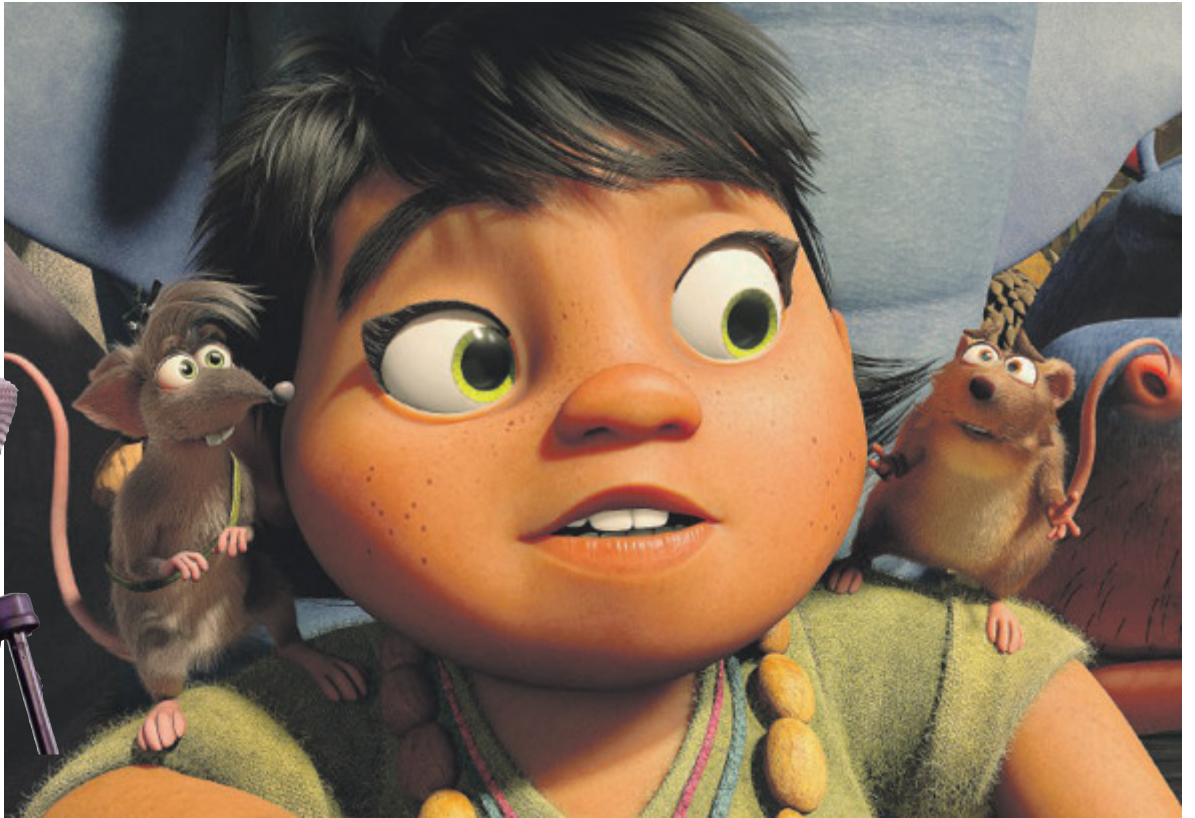
"Tito e Vinni a tutto ritmo" di Sérgio Machado e Alois Di Leo, con le voci della Space Family.