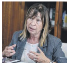
Donatella Tesei, governatrice Tesei.

al meglio i corridori», ha detto la Governatrice Donatella Tesei. A Perugia si valuta la possibilità di chiudere scuole, università e uffici pubblici nelle zone interessate. Dalla sera prima previsti divieti di sosta: verranno individuate aree di sosta alternative per i residenti.