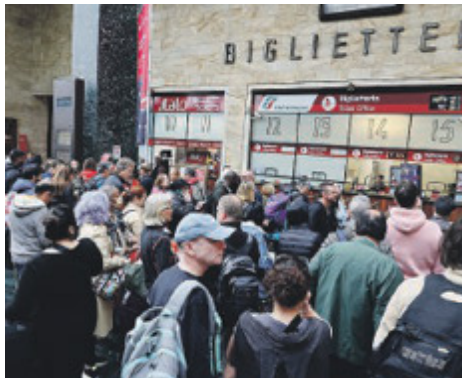
Disagi a Santa Maria Novella

Per un guasto a un treno Intercity proveniente da Foligno infatti, è andato in tilt per ore il traffico ferroviario complicando non poco la giornata ai viaggiatori in arrivo ed in partenza nelle stazioni fiorentine. Il treno intercity 580 è andato in avaria mentre si trovava sulla linea alta velocità Roma-Firenze ed è arrivato in stazione con due ore di ritardo, causando ripercussioni a catena a tutti i treni ad alta velocità provenienti