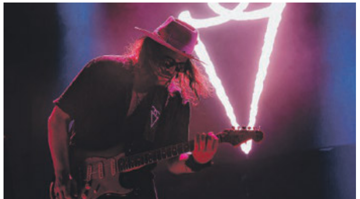
Gianluca Grignani farà tappa con il suo tour live anche nei club di Milano, Torino e Roma.

«Dopo questo tour pubblicherò un libro, poi sarà la volta di un singolo, il primo capitolo della trilogia "Verde Smeraldo" e il resto è un dive-nire... Sono stato tutto questo tempo fermo ad organizzare quello che sta per uscire. Fra qualche giorno, poi, inizio con la prima data e non mi fermerà più nessuno!». È la promessa: parole e musiche by Gianluca Grignani.