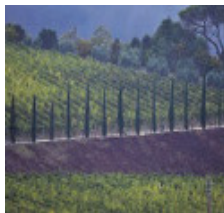
Tra le province di Firenze e Bologna.

poi altre due scosse di magnitudo uguale o superiore a 2: alle ore 4.17 c'è infatti stata una scossa di magnitudo 2.1 e alle 4.22 un'altra scossa di magnitudo 2. precedentemente, nella giornata del 1 aprile, invece si erano registrate diverse scosse a Parma: sempre nella notte e una di mattina.