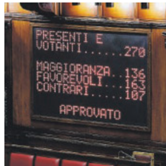
Il risultato del voto.

Chi viene trovato alla guida drogato, invece, non dovrà più necessariamente essere in uno stato di alterazione psico-fisica: sarà sufficiente che risulti positivo al controllo perché scatti la revoca della patente e la sospensione