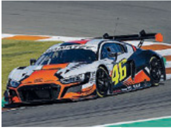
In pista.