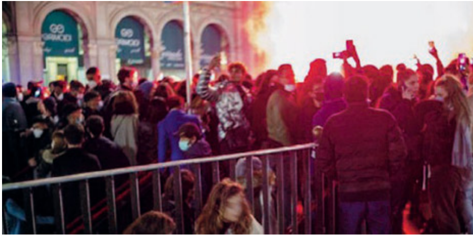
Un momento dei festeggiamenti in piazza Duomo a Milano.