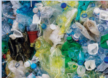
Negli oceani 13 milioni di tonnellate di plastica.

data antecedente al 14 gennaio 2022. E per chi non rispetta le regole sono previste multe che andranno da 2.500 a 25.000 euro. «L'Italia rischia sanzioni Ue per aver introdotto alcune deroghe in contrasto con la direttiva - denuncia Greenpeace - per i prodotti in plastica destinati ad entrare in contatto con gli alimenti la legge italiana consente infatti di aggirare il divieto europeo ricorrendo ad alternative in plastica biodegradabile e compostabile. Un'ulteriore violazione è l'esclusione dal divieto dei prodotti dotati di rivestimento in plastica con un peso inferiore al 10% dell'intero prodotto».