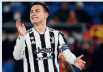
L'argentino: futuro incerto alla Juve.