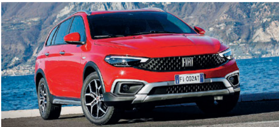
La Tipo Cross Station Wagon.