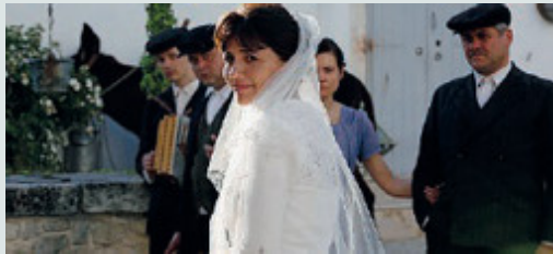
La Sposa, serie tv in 3 episodi su Rai1 con Serena Rossi.