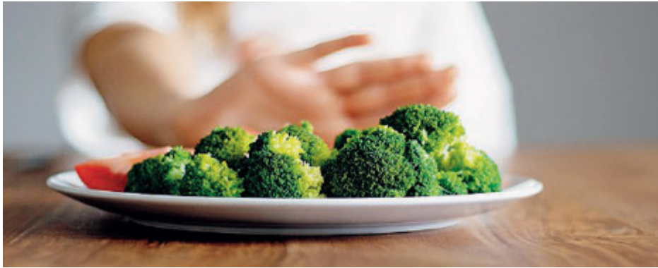
C'è stato un incremento del 40% delle patologie legate all'alimentazione nella fascia adolescenziale