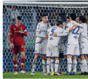
Gol doriano a 10 dal termine.

All'Olimpico si rivedono in sequenza tutti i vizi che Mourinho pensava di aver estirpato: lentezza nella manovra, leggerezze in difesa ed apatia in attacco. Contro una buona Sampdoria la Roma di fatto non gioca il primo tempo. Nella seconda frazione perde Abraham, sostituito da Felix Afena. Ma il gol lo segna Shomodurov, entrato insieme al Faraone dopo che un palo della Sampdoria aveva dato la sveglia a