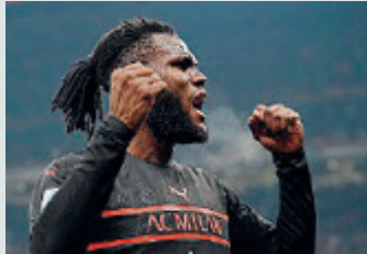
Kessie ieri trequartista.