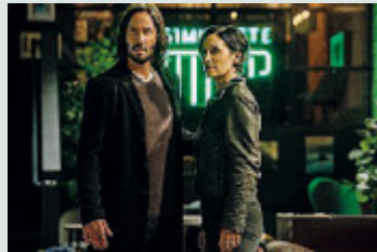
Keanu Reeves e Carrie-Anne Moss nel film.

CINEMA Tanta roba in questo Matrix Resurrections , atteso nuovo capitolo della saga Matrix. Forse, almeno nella prima parte del film, un po' troppa. Anche se le citazioni e i rimandi alle origini fanno venir voglia di rivedere la genesi del gioco dove, alla fine della fiera, hai chiaro il concetto che nella vita è "molto più facile seppellire la realtà che liberarsi del sogno". Una certezza! Così la visionaria regista Lana Wachowski riporta le star Keanu Reeves e Carrie-Anne Moss (straordinari) nei ruoli iconici che hanno reso famosi Neo e Trinity. In Matrix Resurrections le 2 realtà s'intrecciano: la vita quotidiana e ciò che si cela dietro essa. E Thomas dovrà scegliere di seguire ancora una volta il Bianconiglio... Déjà vu.