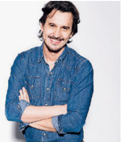
Michieletto regista del film Rigoletto al Circo Massimo su Rai3.

«Bisogna riuscire a raccontare i classici in modo chiaro, preciso e non autoreferenziale. Essendo capolavori eterni, le opere liriche si prestano a varie letture e sta perciò a noi evitare gli stereotipi, riuscire a rappresentare sempre il lato umano in modo autentico. Credo sia im-