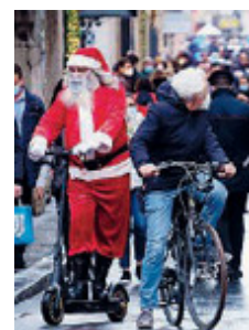
Natale a Roma.