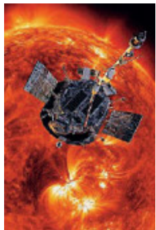
Una simulazione del volo.

Avviata da ieri la vaccinazione dei bambini nella fascia tra 5 e 11 anni. Un migliaio quelli che hanno ricevuto la dose nel Lazio. «Lo hanno fatto con il sorriso - ha detto il governatore Nicola Zingaretti - faccio un appello ai genitori a vaccinare. Non perdiamo tempo, la variante Omicron è insidiosa e si diffonde rapidamente. Sono già 40 mila le prenotazioni per il vaccino in questa fascia». Da oggi al via in tutta Italia.