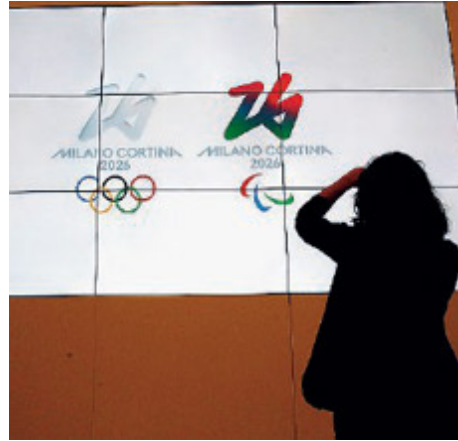
A sinistra il presidente del Coni, Giovanni Malagò.

po», ha aggiunto. Ma le preoccupazioni di Malagò sono anche altre, e riguardano da vicino la città e la giunta di Milano e Cortina 2026. «L'inaugurazione (tutti gli impianti dovranno essere pronti per i "test event" di gennaio 2025): «La cerimonia inaugurale sarà a San Siro, qualsiasi San siro esca, che sia vecchio, nuovo o ristrutturato. Ma non possiamo rischiare ci sia una situazio-