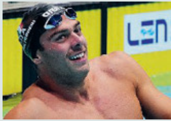
«Super Greg» Paltrinieri.