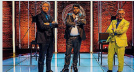
Chef Antonino Cannavacciuolo tra i colleghi Locatelli e Barbieri.

TV «Il regalo più bello? Quello che mi chiede mio figlio ogni volta che mi propone: "Papà, impastiamo insieme?" Al di là di questo, a MasterChef ci sono altrettante storie emozionanti che riguardano i concorrenti e che mi hanno arricchito dandomi motivi di riflessione». Così Antonino Cannavacciuolo alla presentazione della nuova edizione di Masterchef Italia, il cooking show da stasera su Sky e Now, di cui il cuoco è giurato assieme a Bruno Barbieri e a Giorgio Locatelli. «Masterchef è una macchina perfetta anche grazie a questo trio che scherza da mattina a sera». Parola di Chef!