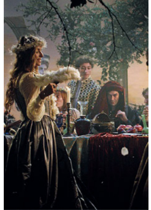
"Botticelli e Firenze. La nascita della bellezza" al cinema in gennaio.

opere come Primavera e Nascita di Venere. La morte di Lorenzo il Magnifico, le prediche apocalittiche del Savonarola e i falò delle vanità, segnano la parabola discendente del maestro fiorentino, destinato a un oblio di oltre tre secoli. La riscoperta di Botticelli per mano dei Pre-Raffaelliti dà il via a un'autentica Botticelli-mania, che dal XIX secolo arriva fino a oggi. Da Salvador Dalí a Andy Warhol, da LaChapelle a Lady Gaga, nessuno sembra immune al fascino dell'inventore della Bellezza. ORI. CIC.