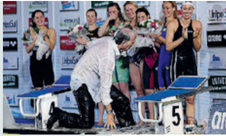
Malagò fradicio.

NUOTO Gli Assoluti di Riccione, ieri, sono stati il teatro di un avvenimento: l'ultima gara ufficiale di Federica Pellegrini (i 200 stile in vasca corta, vinti). Tanta commozione della campionessa e del pubblico. E divertente fuoriprogramma: Giovanni Malagò, n° 1 del Coni, si è tuffato vestito.