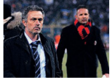
Mourinho e Mihajlovic nel 2008.